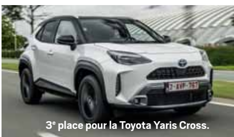
3 e place pour la Toyota Yaris Cross.