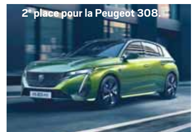
2 e place pour la Peugeot 308.