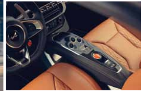
Première place sur le podium pour l'Alpine A110 Légende GT, dotée d'une sellerie cuir brun ambré.